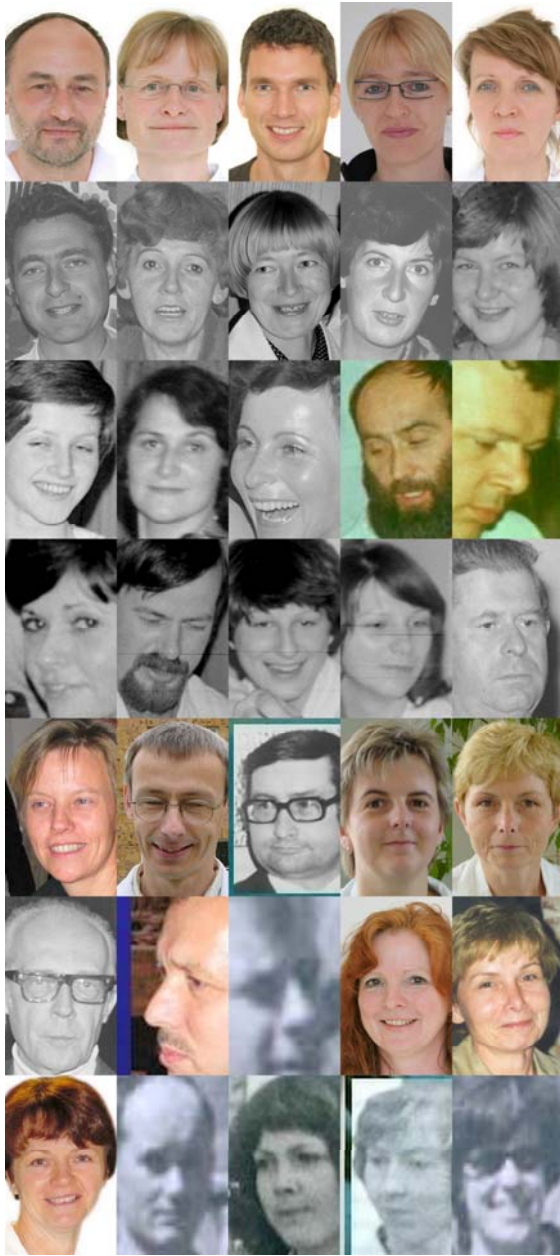
NUK (Rad)- Mitstreiter Uni Greifswald 1970-2010 (Auszug)