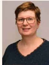
A. Klutentreter Diplom-Psychologin Psychologische Psychotherapeutin Psychoonkologin (DKG)